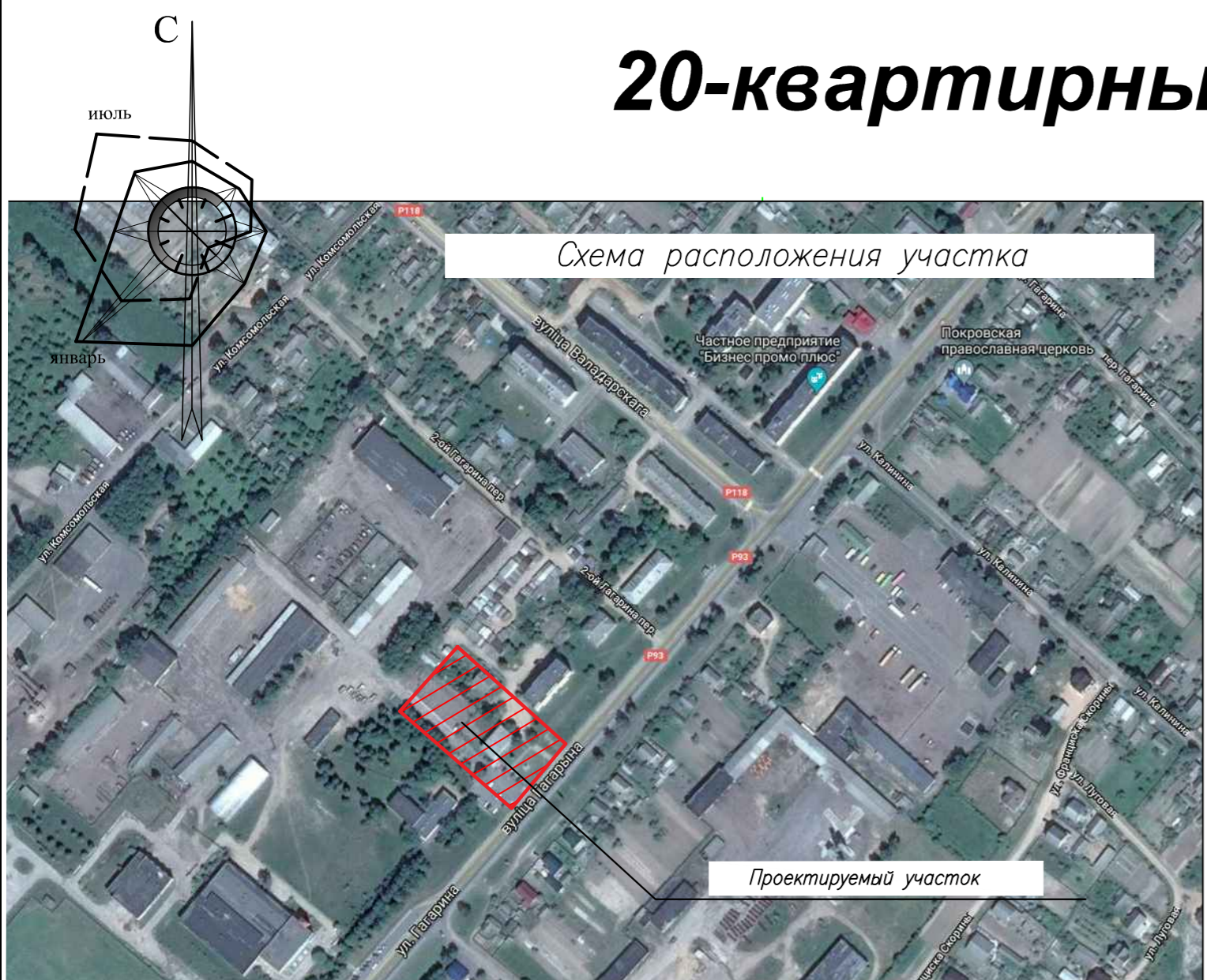
Схема расположения участка